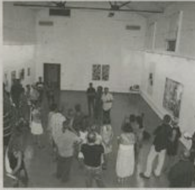
Asistentes a la inauguración de la exposición, el viernes.

Asimismo resaltó que «esta idea ha podido salir adelante gracias a todo el esfuerzo del equipo que conforma la Asociación que durante